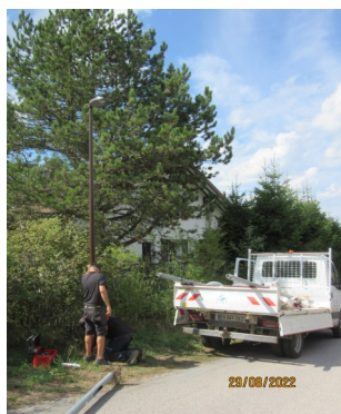
Pose d'un candélabre Led au Fuverat

A noter : les communes du SIEL bénéficient du TRVé (Tarifs Réglementés de Vente de l'électricité) pour leurs contrats d'éclairage public, bâtiments, etc. Il en est de même pour les clients particuliers et les petits professionnels. Ces tarifs fixés par l'État bénéficient du « bouclier tarifaire » et ne sont donc pas soumis aux fluctuations du marché. Toutefois, une hausse de 15 % est prévue pour février 2023 (contre près de 120 % en l'absence de cette protection).