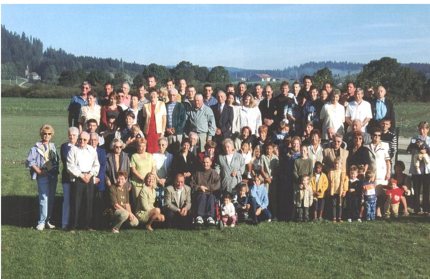
Plus de 500 habitants du village photographiés par quartier en l'an 2000, un fascicule hors-série