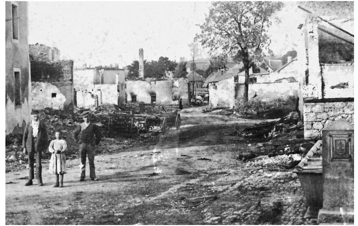
Le terrible incendie du bas du village en 1898 Racines n°3