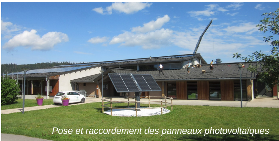
Pose et raccordement des panneaux photovoltaïques

La surface occupée par les panneaux représente environ 425 m 2 . Le démarrage des travaux a été retardé par les difficultés d'approvisionnement des matériels et des onduleurs en particulier, dues à une carence mondiale de semi-conducteurs. L'installation est opérationnelle depuis fin octobre.