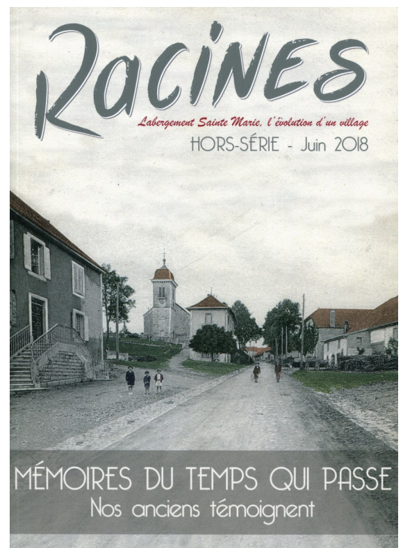
Mémoires du temps qui passe Le témoignage de 40 anciens du village