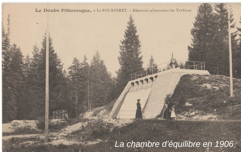
La chambre d'équilibre en 1906

Par ailleurs, très attaché à son Histoire et à son patrimoine, le Syndicat, maître d'ouvrage et maître d'œuvre du projet a souhaité un accompagnement esthétique à cette construction avec la réintégration des 6 arcades au niveau du déversement supérieur, éléments qui avaient été obscurcis lors de sa surélévation en 1968. Les pare-