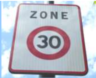
Depuis plusieurs années, la grande rue est limitée à 30 km/h

C'est grâce à cette faible vitesse des véhicules qu'une cohabitation dans de bonnes conditions de sécurité est possible entre les véhicules motorisés et les vélos sur la même chaussée. Elle permet également aux piétons de traverser la voie en tout point, dès lors qu'ils se situent à plus de 50 mètres du passage piéton le plus proche. D'autres panneaux dessinés sur la chaussée rappellent cette règle.