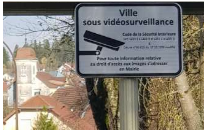
Une signalisation réglementaire a été placée aux entrées de village

Un point sur la vidéoprotection du village : celle-ci a été réquisitionnée près de 30 fois depuis son installation par la gendarmerie pour le captage d'images. Ceci a permis de résoudre un certain nombre de délits et en évitera sûrement d'autres.