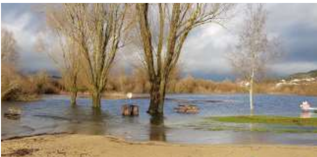
13 décembre 2023 : le haut niveau de l'eau des lacs

Pour répondre aux nouvelles normes obligatoires en 2024, le PPMS (Plan de Sécurité) a été mis en place à l'école publique des deux lacs. Nous en avons profité pour installer les 7 blocs-secours manquants et une baie de brassage pour la gestion de l'alarme, de la fibre, de la vidéo et autres ; les salles de classes ont aussi été équipées de prises RJ45 pour l'installation des vidéo-projecteurs et connections internet.